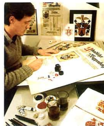
Künstler gestalten für die Kunden Stammbäume und Wappen

Wer Pro Heraldica einen Auftrag erteilt, muss mit einem Zeitrahmen von mindestens einem Jahr rechnen, bis alles recherchiert und redaktionell aufbereitet ist. Den Umfang einer Forschung kann jeder selbst bestimmen. Kosten variieren je nach Dauer, Inhalt und Form der Umsetzung des Ergebnisses.